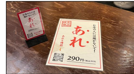
図2 PoCから本格導入された飲食店の仕掛け