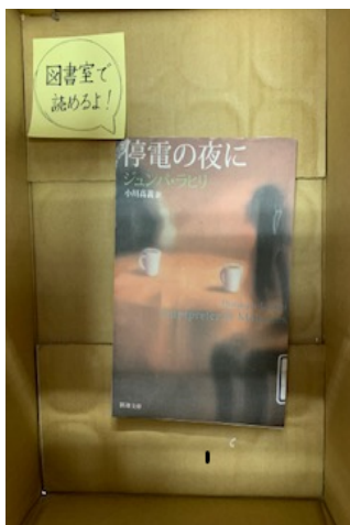
図2 仕掛け②家を模した箱 図3 左の写真の内部